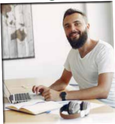
4. Mijn vorming