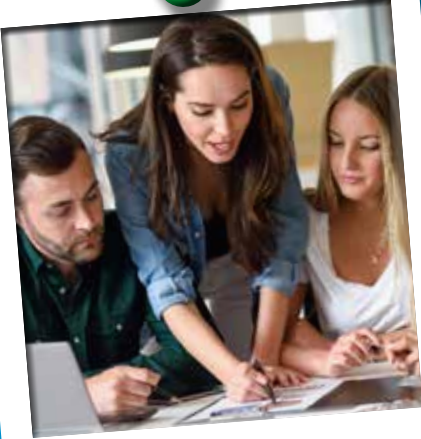
1. Samen werken aan een Aangenaam Aartselaar