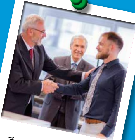
7. Specifieke stelsels