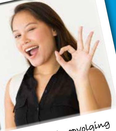
3. Feedback, opvolging en evaluatie