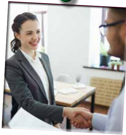
2. Mijn loopbaan