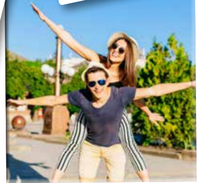
6. Mijn verlof