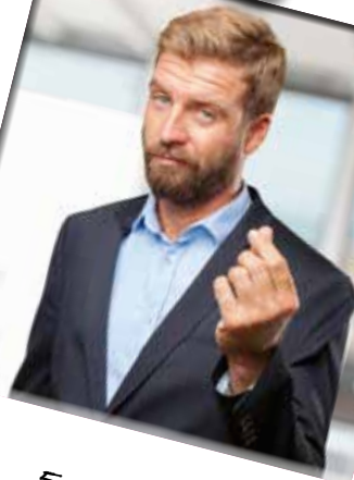
5. Mijn loon